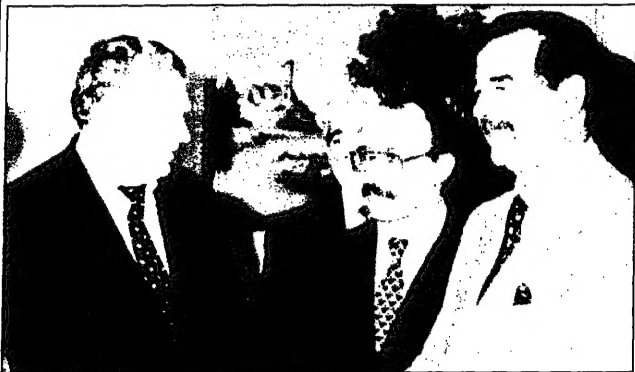
الوزير الأمريكي للمدافع جيمس موريسون (يسار) ورئيس الوزراء السعودي عبد العزيز بن عبد الرحمن آل سعود (يمين) مع وزير الدفاع الأمريكي وليام كوهين (وسط).

واشنطن - لندن - نيويورك البنتاغون الأمريكي أعلن تصعيد التهديدات العسكرية التي تستهدف العراق في ضوء استمراره في رفضه التخلي عن أسلحته الكيميائية والبيولوجية والذرية. وقال مسؤولون أمريكيون إن بنتاغون يهدد بضربة «تمحو مواقع عراقية من الوجود» إذا لم يتوقف عن تطوير أسلحته الخطيرة. وقال مسؤولون أمريكيون إن بنتاغون يهدد بضربة «تمحو مواقع عراقية من الوجود» إذا لم يتوقف عن تطوير أسلحته الخطيرة. وقال مسؤولون أمريكيون إن بنتاغون يهدد بضربة «تمحو مواقع عراقية من الوجود» إذا لم يتوقف عن تطوير أسلحته الخطيرة.